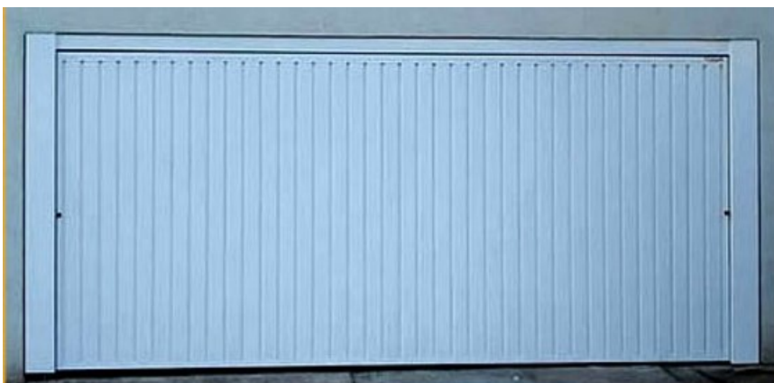
2 Portões de Aço