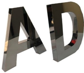
Letreiros em Aço Inox