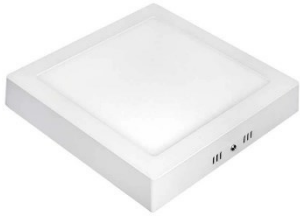
4 Painel de LED 30x30 25W