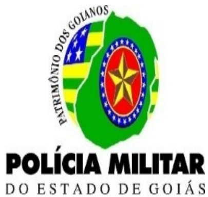
Logo da Polícia Militar – Desenho