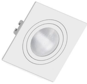
12 Dicroicas de Embutir em LED