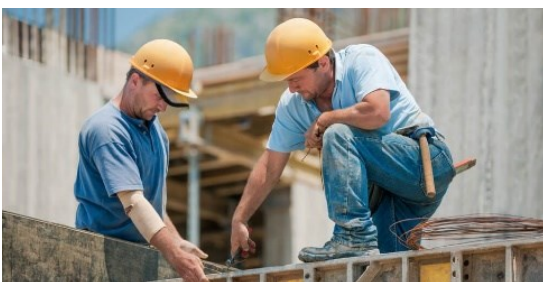
Mão de Obra;