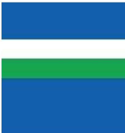
Faixa da Polícia Militar – Pintura